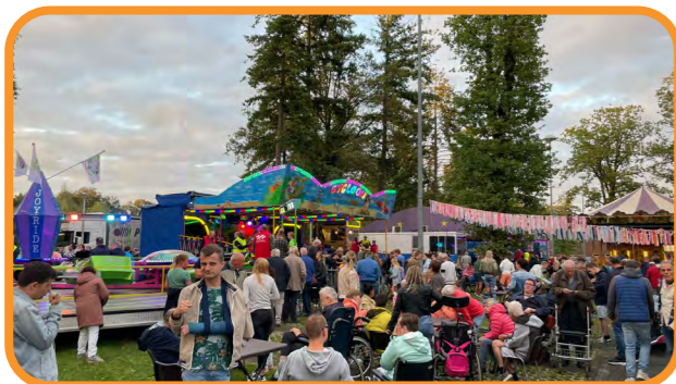
Veel mensen gingen naar de kermis