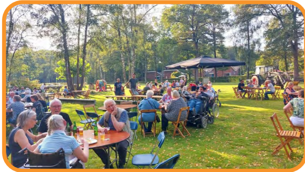
We gingen samen eten