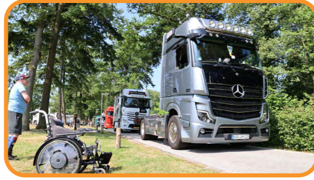
Gezellig meerijden met vrachtwagens