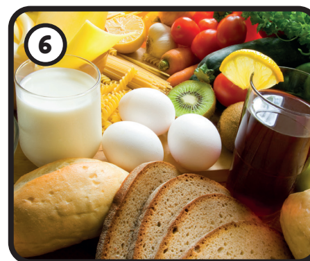
Eten en drinken