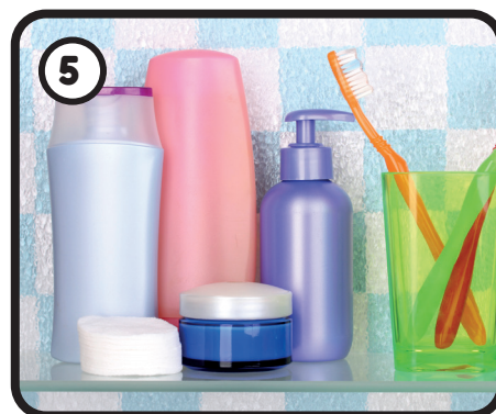
Douche- en toiletpullen