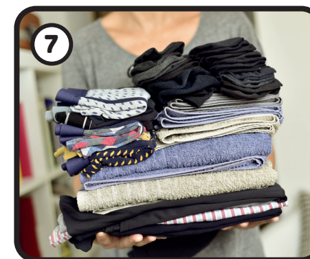
Kleding en schoenen